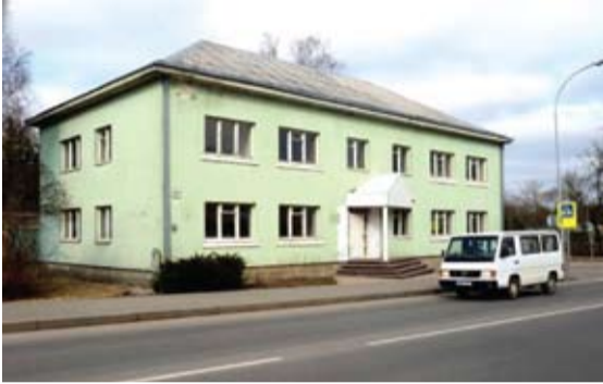
Buvusį Anykščių bibliotekos pastatą kitą mėnesį bus bandoma parduoti aukcione.

Aukcione už 134 tūkst. Eur nupirkta buvęs Anykščių bibliotekos pastatas pirkėjams dabar siūlomas už dvigubai didesnę kainą.