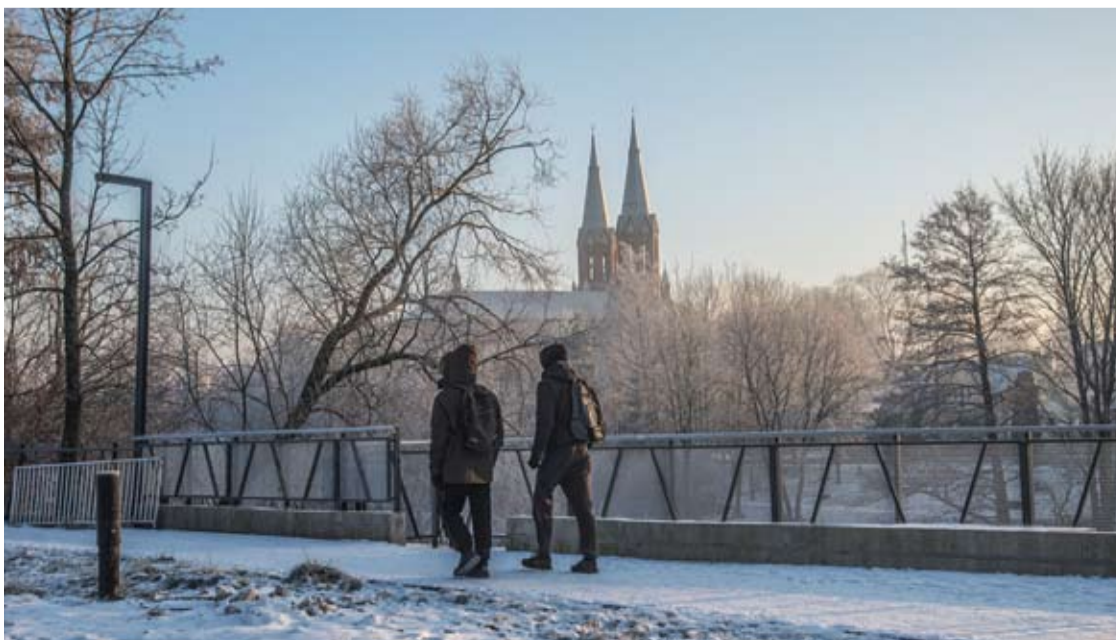
Prieš metus Anykščių rajone gyveno 25 tūkst. 34 gyventojai, šių metų pradžioje – 24 tūkst. 440.