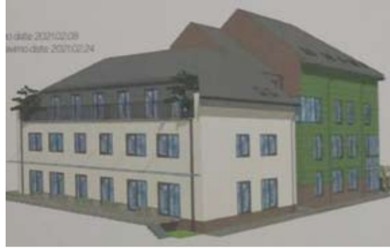
Planuoto daugiabučio projektiniai pasiūlymai susilaukė nemažai architektų kritikos.

Viena nekilnojamo turto pardavimo įmonė bibliotekos pastatą siūlo aukcione pirkti už 270 tūkst. Eur: „Vystymo galimybė Anykščių miesto centre: parduodamas bibliotekos pastatas su pagalbiniais pastatais, kuriems yra patvirtinti projektiniai pasiūlymai 18 butų daugiabučio namo projekto plėtrai“, - rašoma skelbime.