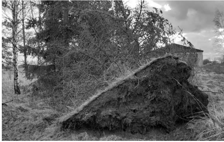
Sinoptikai praneša, kad savaitgalį audringas vėjas šiek tiek rims, bet išliks gūsingas, siekiantis iki 20 m/s.

Meteo.lt pranešė, kad Lietuvoje fiksuotas katastrofinio sti-